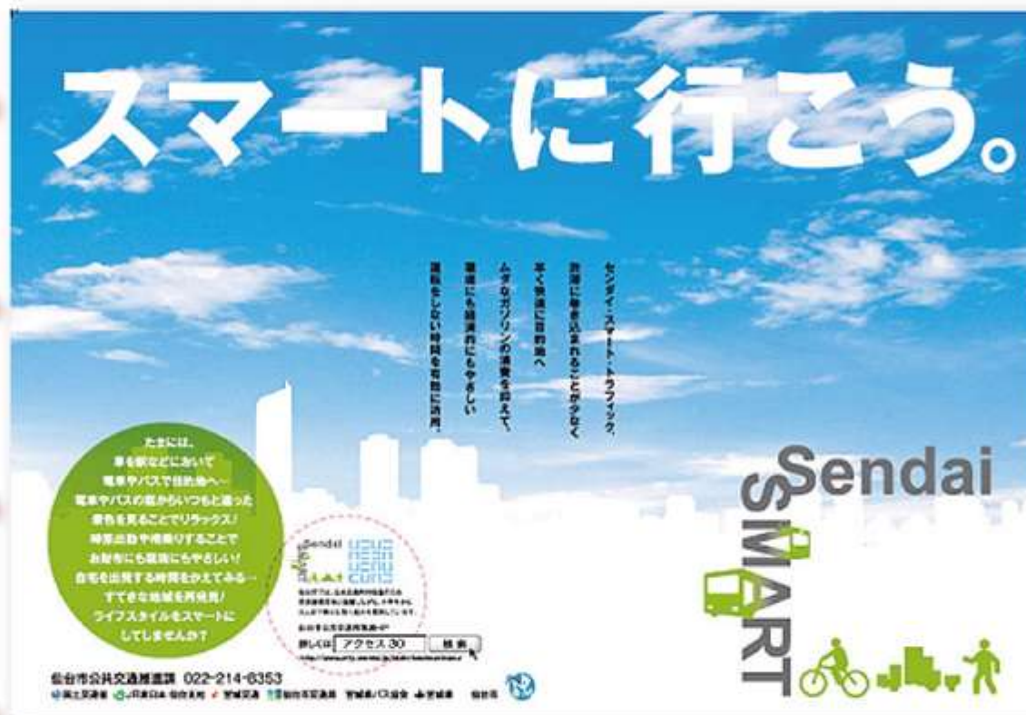
▲せんだいスマート告知ポスター