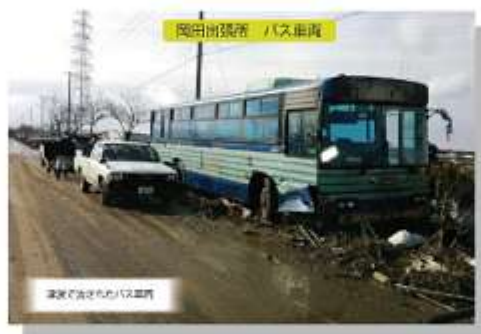
津波で流された→ バス車輛