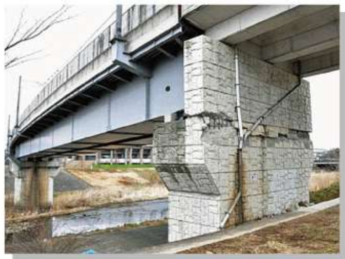
↑地下鉄南北線 橋脚