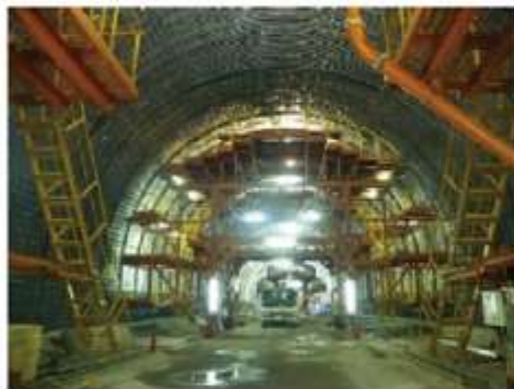
←地下鉄東西線 亀岡トンネル 工区の現況