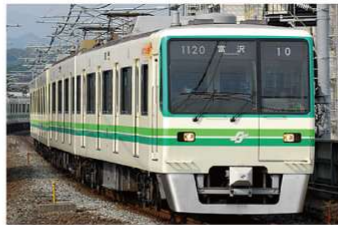
地下鉄南北線 / 八乙女付近