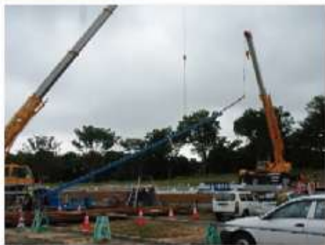
地下鉄東西線→ 軌道工事