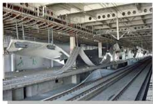
東北新幹線 仙台駅及び 高架橋電柱破損