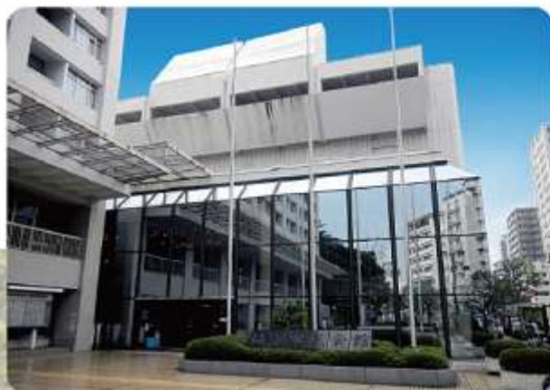
仙台市民会館エントランス