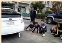
自動車工場(排ガス調べ)