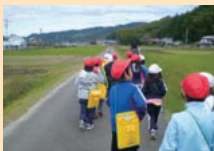
わたしたちの町をたんけんしよう